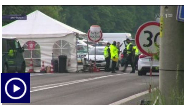
Trudna walka z pandemią