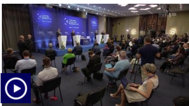
Szczyt Trójmorza w Sofii