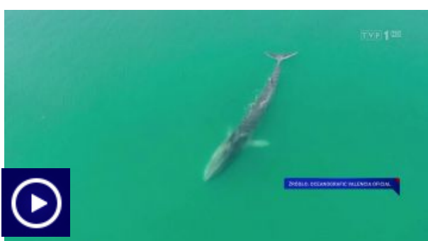
Zagubiony wieloryb w porcie w Walencji